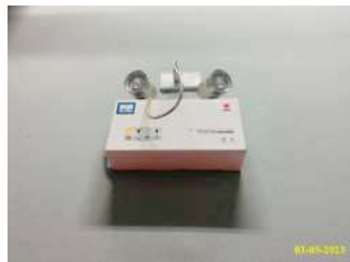
ภาพที่ 1.3.7-2 ระบบไฟฟ้าฉุกเฉิน