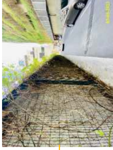
ภาพที่ 1.3.2-1 พื้นที่สีเขียว