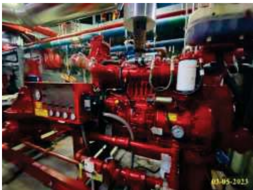
เครื่องสูบน้ำดับเพลิง