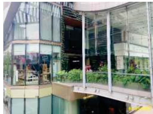
ทางเชื่อมเข้าห้างแพลทินัม แพลชั่น มอลล์