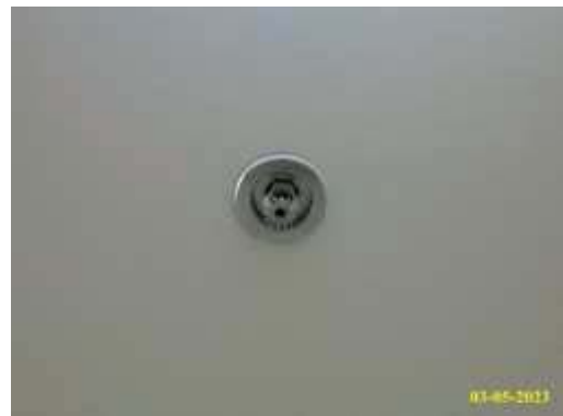
หัวกระจายน้ำดับเพลิง