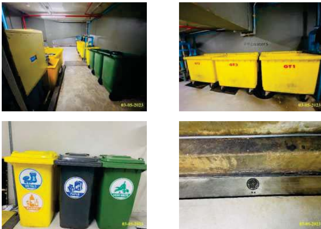
ภาพที่ 1.3.6-2 ห้องพักมูลฝอยรวม