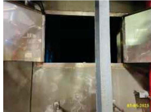
ถังสำรองน้ำชั้นใต้ดิน