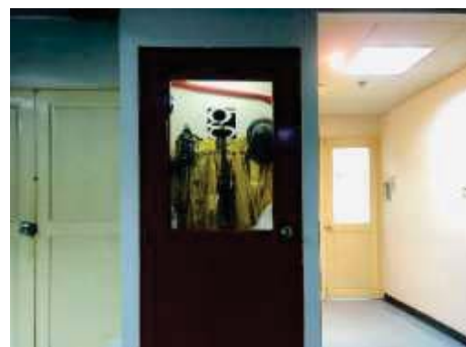
ชุดผจญเพลิง