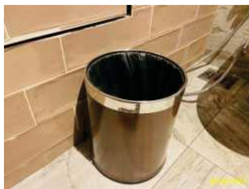
ถังรองรับมูลฝอยบริเวณพื้นที่ส่วนกลางและศูนย์การค้า