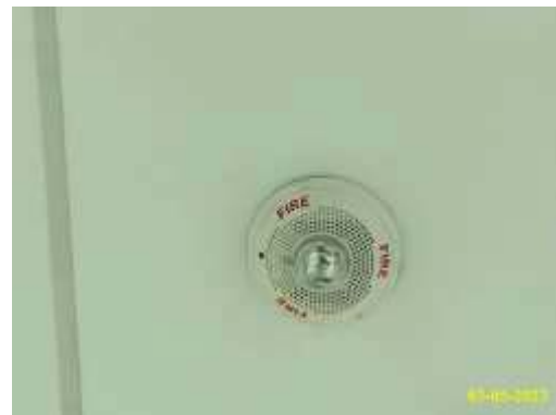
กริ่งสัญญาณ