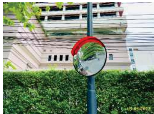
ภาพที่ 1.3.10-2 ป้ายสัญลักษณ์และทิศทางการจราจร