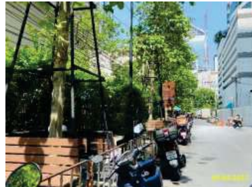
พื้นที่จอดรถจักรยานยนต์