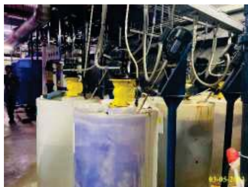
ภาพที่ 1.3.4-2 ระบบรีไซเคิลน้ำ