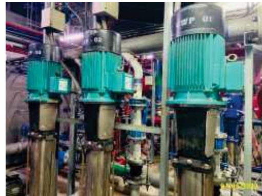
เครื่องสูบน้ำ