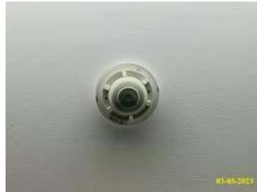
เครื่องตรวจจับความร้อน