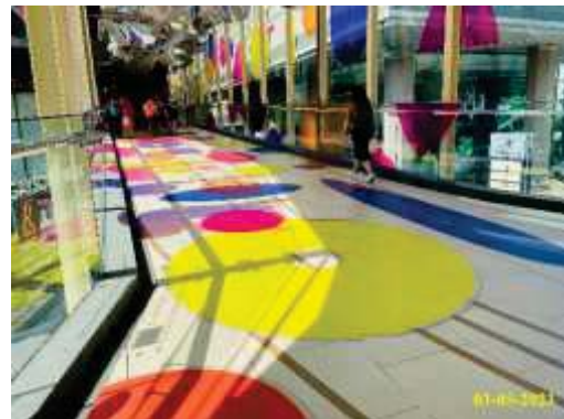
ภาพที่ 1.2-2 สภาพปัจจุบัน