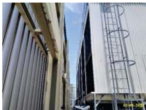
หอผึ่งเย็น (Cooling Tower)