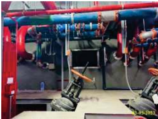
ถังสำรองน้ำดับเพลิง