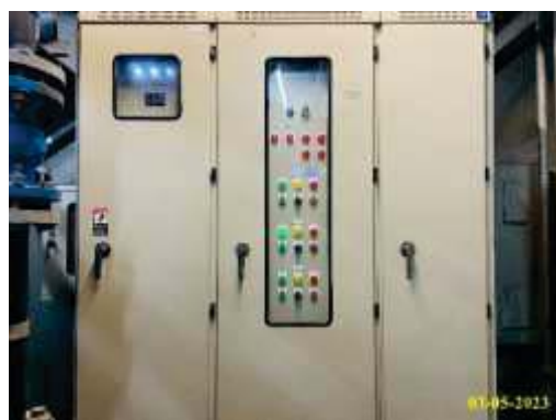
ระบบระบายน้ำภายนอกโครงการ