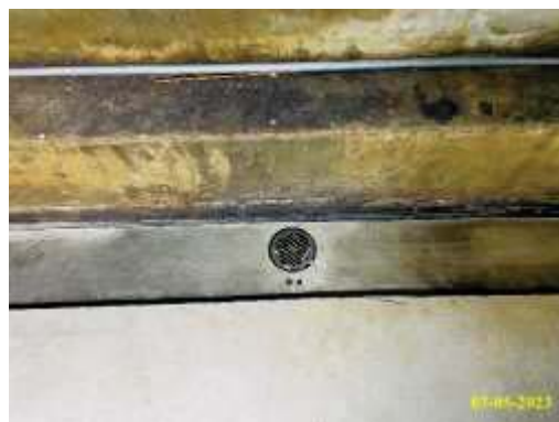
ระบบระบายน้ำภายในอาคาร