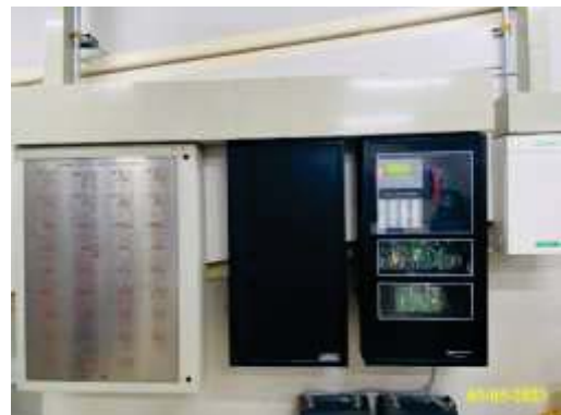
แผงควบคุม