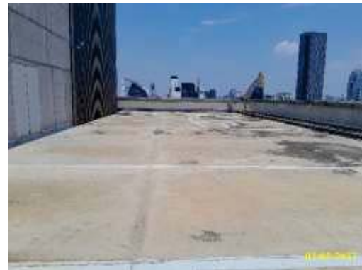
ภาพที่ 1.3.8-3 พื้นที่หนีไฟทางอากาศ