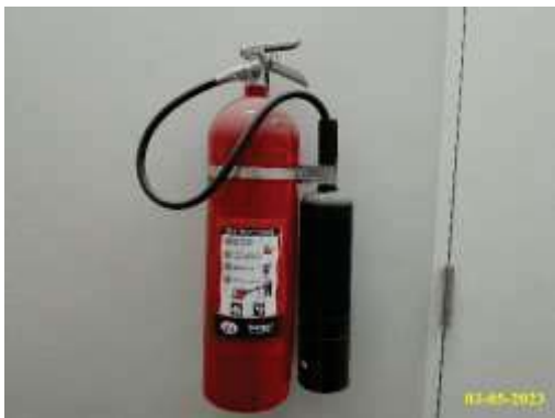
ถังดับเพลิง