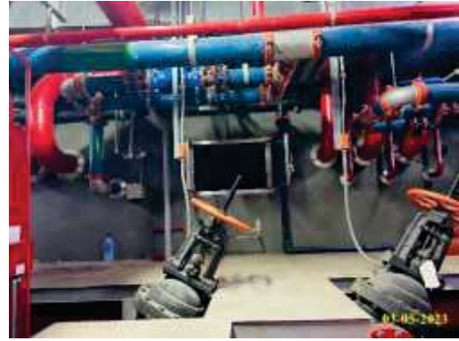
ถังสำรองน้ำดับเพลิง