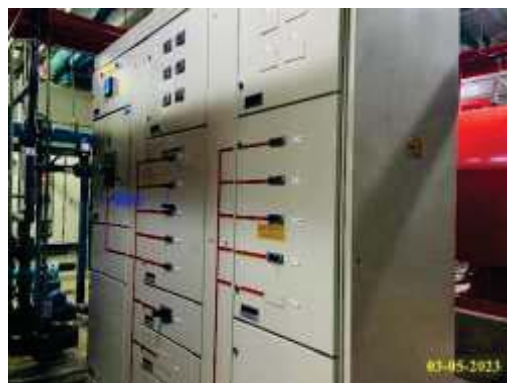
ภาพที่ 1.3.4-1 ระบบบำบัดน้ำเสีย