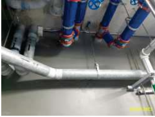
ถังเก็บน้ำชั้นดาดฟ้า