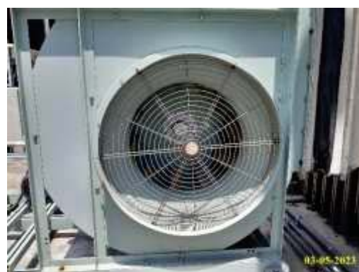
ภาพที่ 1.3.9-2 ระบบระบายอากาศ