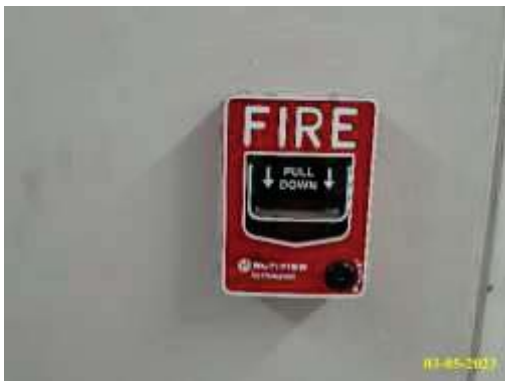
เครื่องแจ้งเหตุด้วยมือ