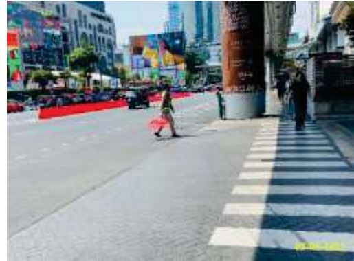
ภาพที่ 1.3.10-1 ทางเข้า-ออกโครงการ