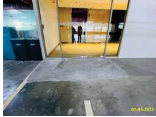
ทางลาดสำหรับคนพิการ/คนชรา