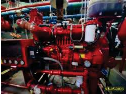
เครื่องสูบน้ำดับเพลิง