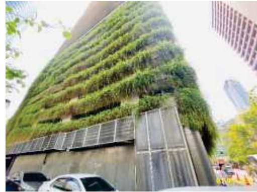
ภาพที่ 1.3.2-2 Green Wall บริเวณชั้นจอดรถชั้นที่ 2 - ชั้นที่ 9