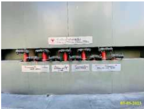
หัวรับน้ำดับเพลิงนอกอาคาร