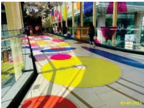
ทางเชื่อมเข้าสู่สถานีรถไฟฟ้าบีทีเอส