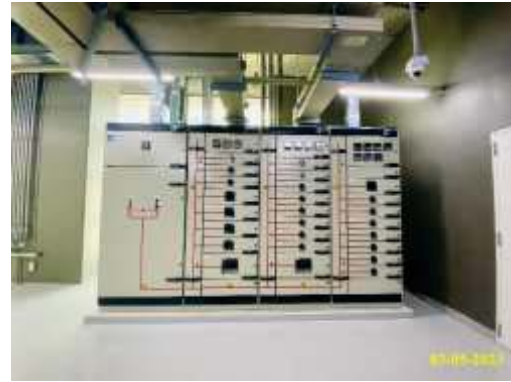
ภาพที่ 1.3.7-1 ระบบไฟฟ้าปกติ