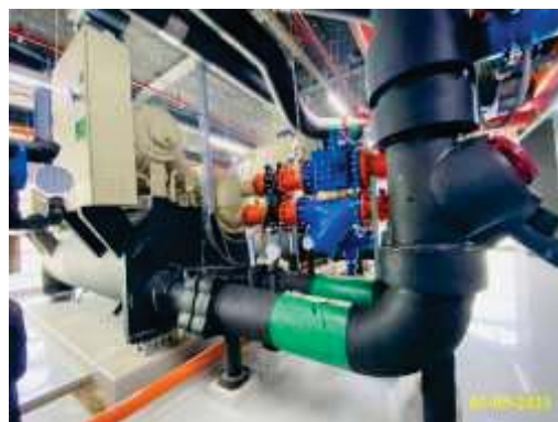
Water Cooled Chiller