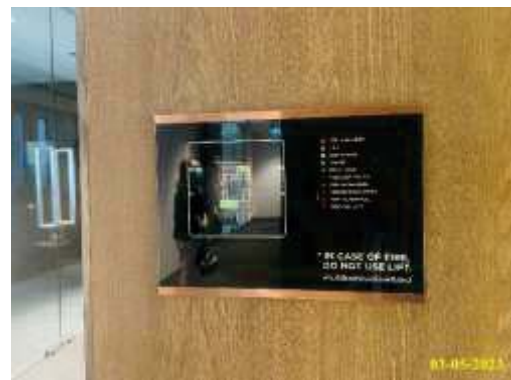
ผังแสดงเส้นทางหนีไฟ