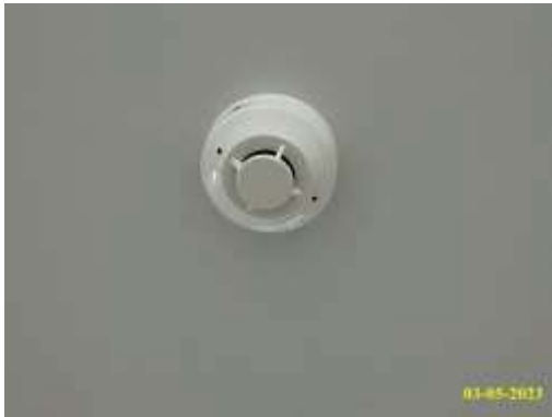
เครื่องตรวจจับควัน