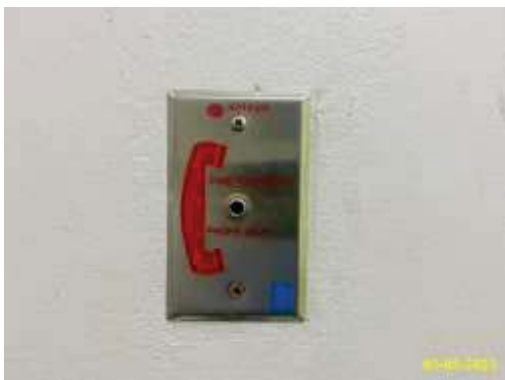
โทรศัพท์ฉุกเฉิน