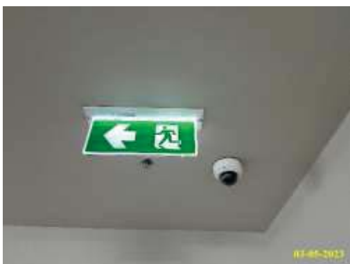
ป้ายบอกทางหนีไฟ