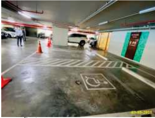
พื้นที่จอดรถสำหรับคนพิการ/คนชรา