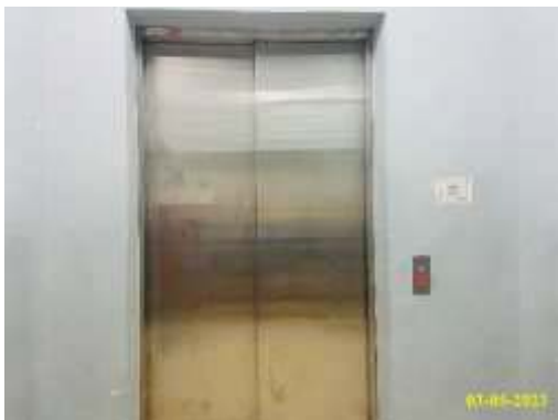
ลิฟต์ดับเพลิง