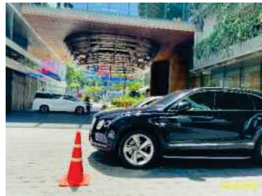
ภาพที่ 1.3.8-4 จุดรวมพล