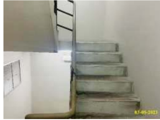
ภาพที่ 1.3.8-2 บันไดหนีไฟ