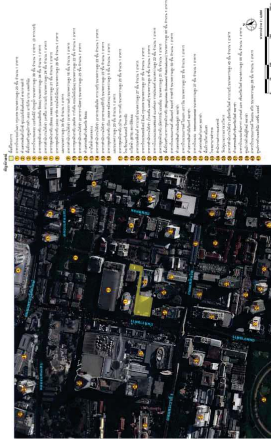
ภาพที่ 1.2.2-1 ที่ตั้งโครงการ