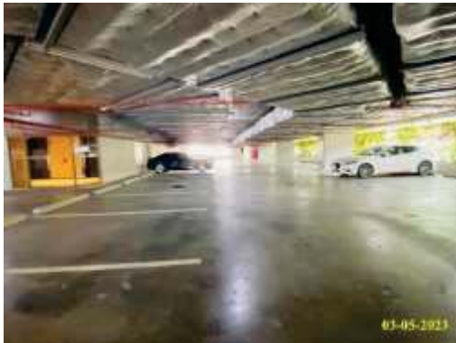
พื้นที่จอดรถบนอาคาร