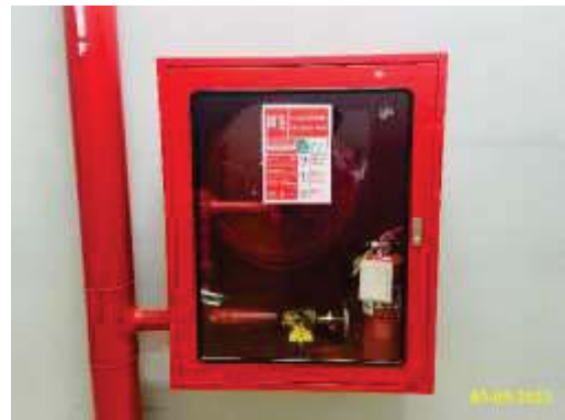
ตู้เก็บสายฉีดน้ำดับเพลิงพร้อมอุปกรณ์