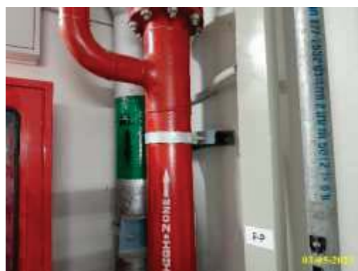
ระบบระบายน้ำฝนจากชั้นหลังคา